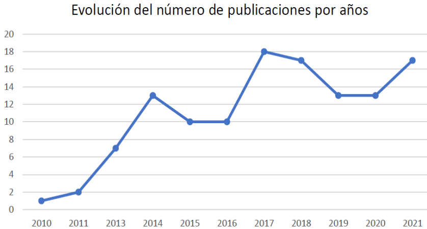
Figura 2. Evolución del número de publicaciones por año.

En la tabla 1 se muestran las áreas de investigación de cada uno de los estudios de pádel incluidos en la revisión. Se puede observar que un 35% de los artículos han sido publicados sobre el análisis del rendimiento deportivo, seguido de áreas relacionadas con las Ciencias de la Salud, como la medicina y la fisiología o la condición física (casi un 30% de los trabajos) y en menor medida, áreas de las Ciencias Sociales, como la psicología (aproximadamente 10% de los trabajos), y metodología, biomecánica, gestión deportiva o sociología (entre el 5% y el 6% de los trabajos cada temática).